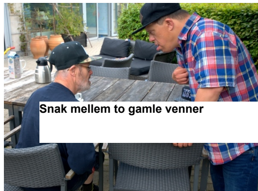
Snak mellem to gamle venner

Handicaprådets møder har siden november 2008 været indledt med et tema af interesse for rådet. I 2017 har temaerne været: