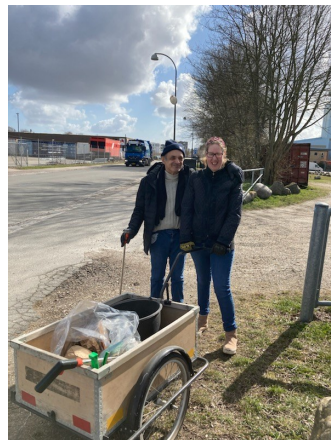
Der samles skrald

Handicaprådet har en stor interesse i at sikre god tilgængelighed for borgere med funktionsnedsættelser, både i byrummet undervejs i byggeriet og i det færdige byggeri.